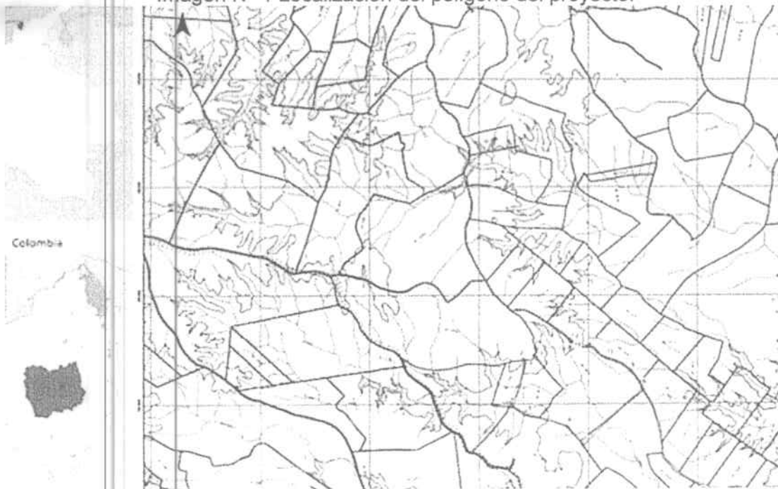
Imagen N° 1 Localización del polígono del proyecto.

El proyecto se localiza en el departamento del Atlántico en jurisdicción del Municipio de Sabanalarga, a 6 km de la cabecera municipal, en los predios "Las Lajas" y "Güaimaral". La planta solar ocupa un área aproximada de 64.9 has, en coordenadas 74°53'2.93" O y 10° 34' 22.28" N.